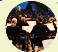
Hakuna Matata · IC-Falkenberg Brandenburger Symphoniker

22.8.26 – 19.30 Uhr | 23.8.26 – 17.30 Uhr BENEFIKONZERT UND NACHMITTAGSKONZERT DER BRANDENBURGER SYMPHONIKER