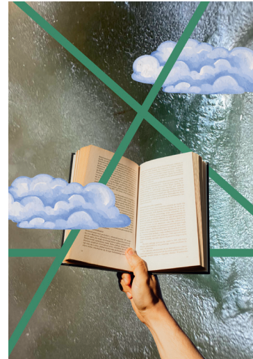
Hintergrund © Dr. Alexander Busche, Motiv © Canva – erstellt mit KI

03381/511-111 · www.brandenburgertheater.de